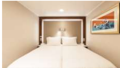
พัก 1-2 ท่าน

From 13 - 14 sq.m Max Occupancy 2-4 + Deck 5/8/9/10/11/12/13/15 2 Single Beds / 2 Single Beds + 1 Ceiling Pullman Bed / 1 Single Bed + 1 Pullman Bed + 1 Double Sofa Bed