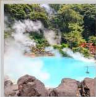
"BEPPU UMI JIGOKU"