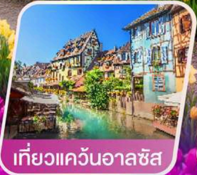
เที่ยวแคว้นอาลซัส