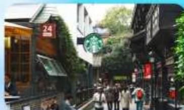
ถนนชอยกวางซวยแคบ