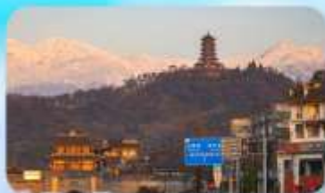
เมืองโบราณกวนเสี้ยน