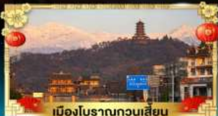
เมืองโบราณกวนเสียน