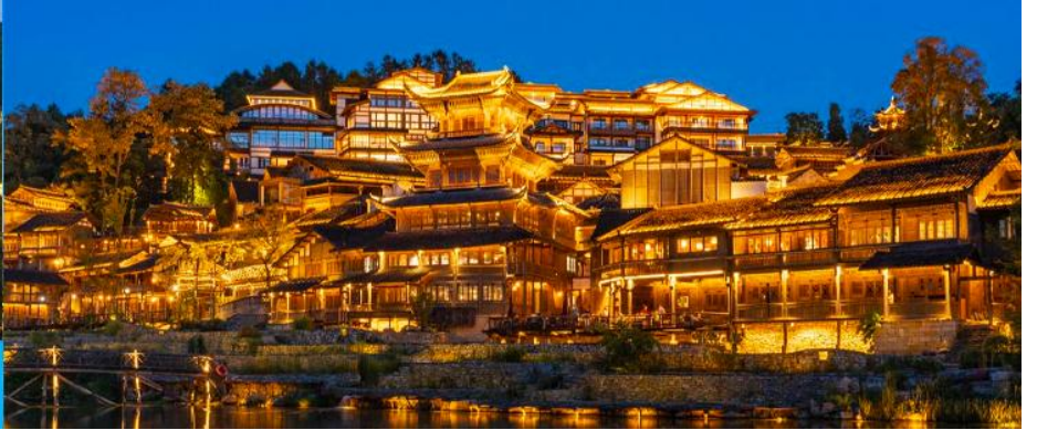
เมืองโบราณวูเจียงจ้าย

หลังอาหารนำท่านเที่ยวชม เมืองโบราณวูเจียงจ้าย 乌江寨景区 เป็นอุทยานท่องเที่ยวริมเมืองโบราณชนเผ่าเหมียว (ชนเผ่าม้ง) ที่ได้ชื่อว่ามีวิวกลางคืนที่สวยงามที่สุดของมณฑลกุ้ยโจว อุทยานนี้รวมไว้ซึ่งแหล่งท่องเที่ยว สถานที่ถ่ายทำภาพยนตร์ ร้านอาหาร รีสอร์ท ศูนย์ประชุม ด้วยทุนสร้างกว่าหมื่นล้านหยวน สัมผัสบ้านเรือนโบราณของชนเผ่าเหมียว ซึ่งเป็นชนกลุ่มหลักที่พำนักในพื้นที่มานานนับพันปี ปัจจุบันชนเผ่าเหมียวยังคงรักษาไว้ซึ่งขนบธรรมเนียมและวิถีชีวิตแบบดั้งเดิม ชมการแสดงพื้นเมือง และการละเล่นพื้นเมืองของชนกลุ่มน้อยต่าง ๆ ในช่วงหัวค่ำบ้านทุกหลังในอุทยานจะประดับด้วยแสงไฟที่งดงาม และมีการแสดงต่าง ๆ อาทิ การบินโดรน น้ำพุ และการยิงแสงเลเซอร์ ฯลฯ (ค่าทัวร์รวมค่ารถรับส่งภายในเขตอุทยาน ค่าทัวร์ไม่รวมค่านั่งเรือแจวในเขตอุทยาน)