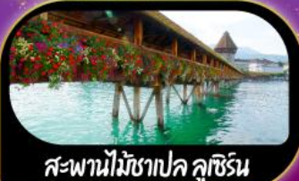
สะพานไม้ฆาปค ลูซิริน