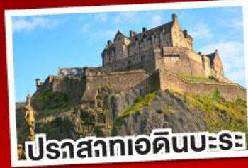
ปราสาทเอдинบะระ