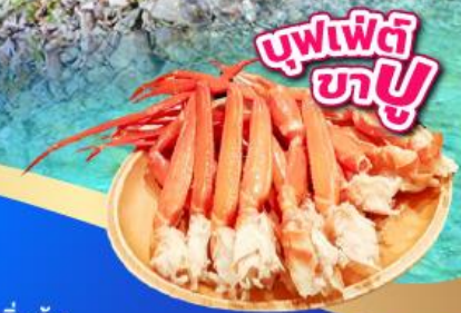
บุฟเฟ่ต์ ชาบู