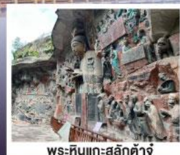
พระหินแกะสลักตัวจู้