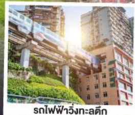
รถไฟฟ้าวงจรถูกติก

พระหินแกะสลักตัวจู้ หลุมบ่อฟ้าสะพานสวรรค์ เขานางฟ้า อุทยานสี่ครุณี อุทยานปีผิงโกว