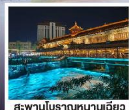
สะพานโบราณหนานเฉียว