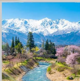
“HAKUBA OIDE PARK”