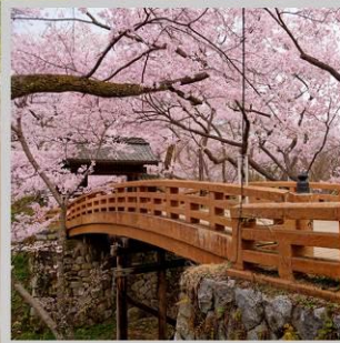
“TAKATO CASTLE RUINS”