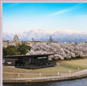
"TOYAMA KANSUI PARK"