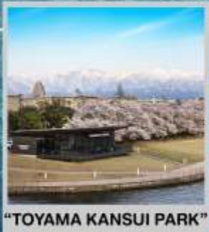
"TOYAMA KANSUI PARK"