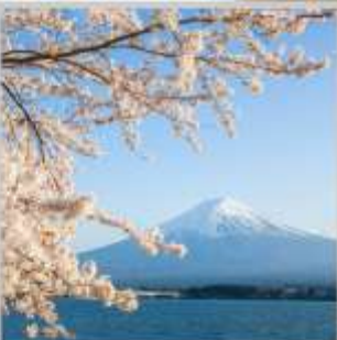
"LAKE KAWAGUCHIKO SAKURA"