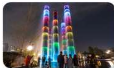
น้ำพุไม้ไผ่