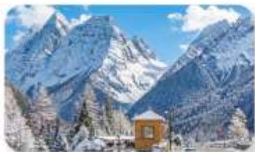
ภูเขาหิมะครุณี