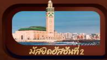
มัสยิดฮัสซันที่ 2

มือพิเศษ อาหารไทย-จีน อาหารพื้นเมืองโมร็อกโก