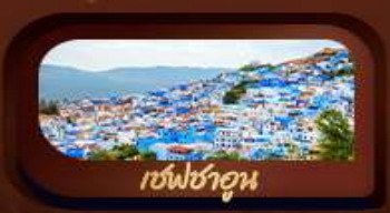
เชฟชาอูน

พิเศษ! นั่งรถ 4WD ขับลุยทะเลทรายซาฮารา และมีอูฐชมพระอาทิตย์ตกดิน