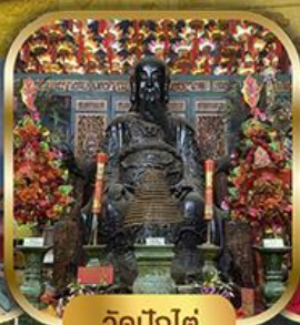
วัดปึกใต้