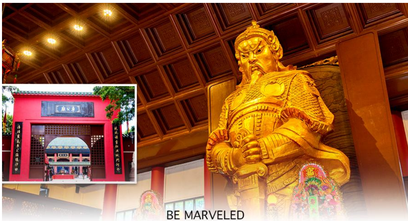
BE MARVELED วัดแชกง

นำท่านเดินทางสู่ วัดแชกงหมิว หรืออีกชื่อหนึ่งว่า “วัดกั๊กหันลม” หนึ่งในวัดดังของฮ่องกง ที่ประชาชนให้ความเลื่อมใสศรัทธามานาน ด้านในศาลจะมีรูปปั้นสูงใหญ่ของท่านแชกง ซึ่งเป็นเทพประจำวัดแห่งนี้ เชื่อ ว่าองค์ท่านศักดิ์สิทธิ์ในการขอพรด้านโชคลาภ เสริมความเป็นสิริมงคล ปิดเป่าเรื่องร้ายๆออกไป และวัดแห่งนี้ยังเป็น สถานที่ที่นิยมสำหรับท่านที่ต้องการแก้ปีชงอีกด้วย โดยวิธีการไหว้ขอพรจากท่านแชกงนั้น ท่านจะต้องเข้าไปยืนอยู่เบื้อง หน้ารูปปั้นของท่าน แล้วอธิษฐานขอพรพร้อมกับมองหน้าท่านอย่างมุ่งมั่นตั้งใจ จากนั้นให้ท่านทำพิธีหม้อน “กั๊กหันแห่ง โชคชะตา” หรือ “กั๊กหันนำโชค” เพื่อหม้อนรับแต่สิ่งดีๆ ให้เข้ามาในชีวิต