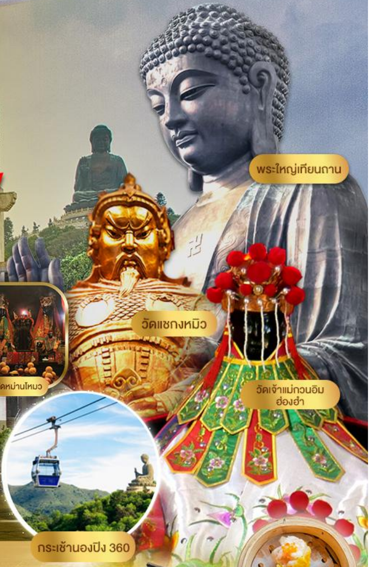
พระใหญ่เทียนถาน