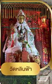
วัดหลันฟ้า