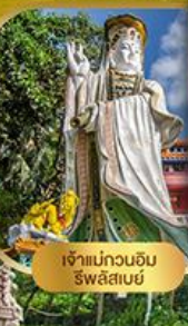
เจ้าแม่กวนอิม ริวสิสเมย์