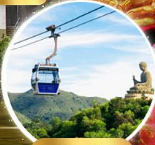
กระเช้าองปิง 360