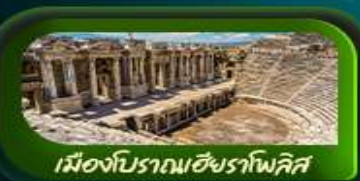
เมืองโบราณฮิเอราโพลิส

อิสตันบูล ปามุกคาเล คัปปาโดเกีย ERCIYES MOUNTAIN SKI