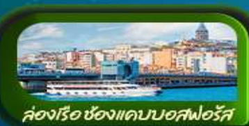
คลองเรือ ช่องแคบบอสฟอรัส