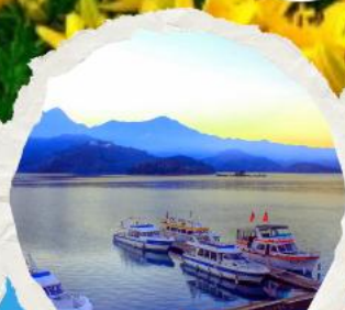
ทะเลสาบสุริยขึ้นจินทารา