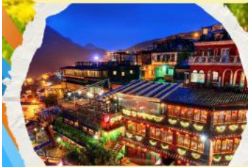
หมู่บ้านโบราณฉิวเฟิง