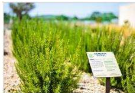
The Mediterranean Garden