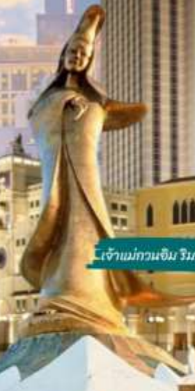
เจ้าแม่กวนอิม วิมตะเภา