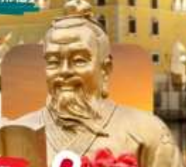
วัดของงาช้าง