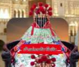
วัดพระนางพันทิพย์