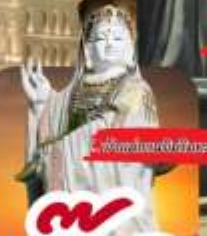
วัดพระนางพันทิพย์