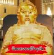
วัดพระทองของจีน