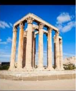
Temple Of Olympian