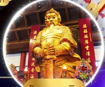
วัดแซกงหมิว