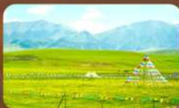
ทุ่งหญ้าออร์คอส