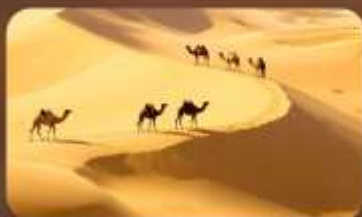
เนินทรายเสียงซาวาน