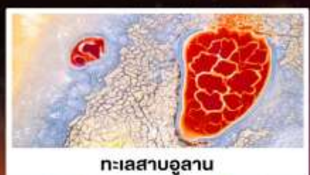
ทะเลสาบอูลาน