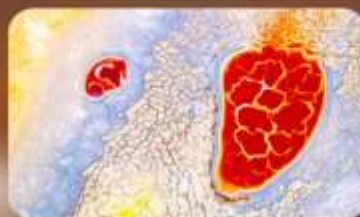
ทะเลสาบอูแลาน