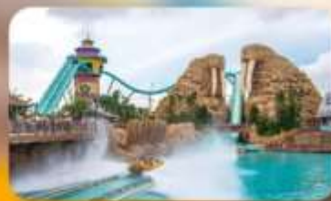
Chimelong Ocean Kingdom