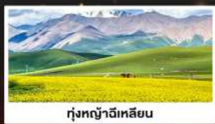
ทุ่งหญ้าฉีเหลียน