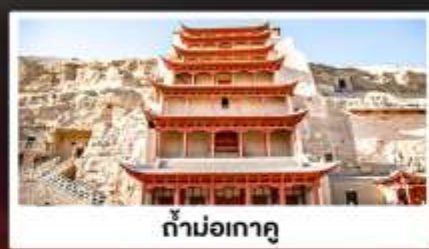
ถ้ำม่อเกาตู