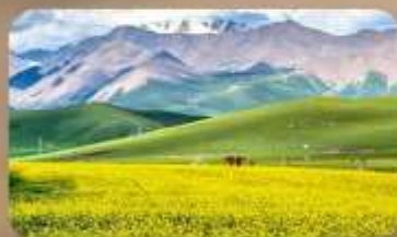
ทุ่งหญ้าซีเหลียน