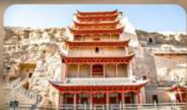
กำม่อเกาคู