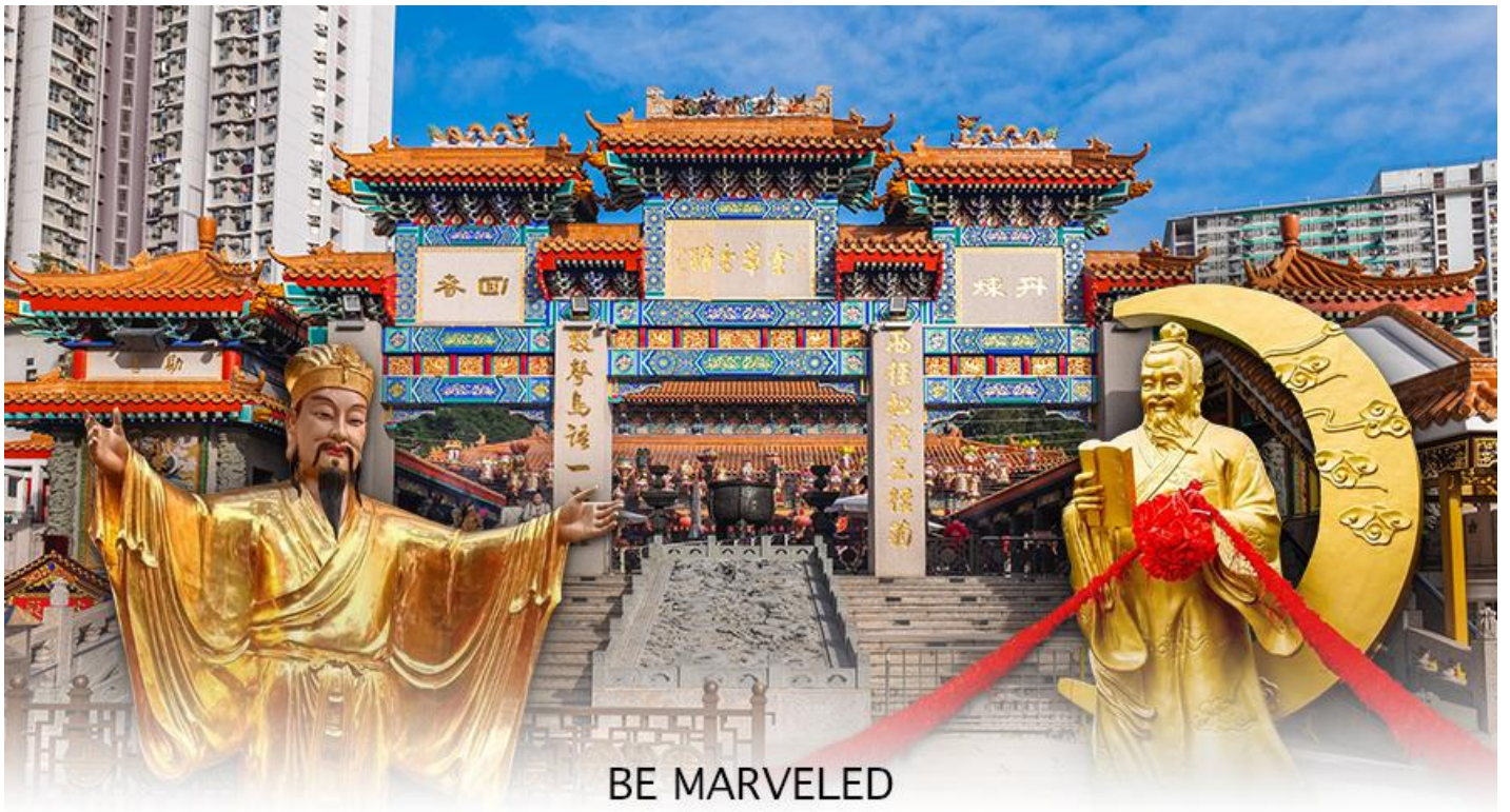
BE MARVELED วัดหวังต้าเซียน

อย่างยิ่งคือ เทพเจ้าหยุก โหลว หรือ เทพเจ้าแห่งความรัก ที่เราเรียกกันว่า เทพเจ้าด้ายแดง เป็นพิภพที่หลายๆ คนมักจะไปขอความรักจากท่านกัน นอกจากนี้ที่เราจะต้องเอาด้ายแดงมาพันมือนี้อีก ตามป้ายที่แนะนำข้างหน้าแล้ว ไกด์นำเที่ยวคนฮ่องกงบอกมาว่าถ้าเป็นผู้หญิงอย่างเราอยากได้แฟน ก็ต้องไปผูกด้ายที่รูปปั้นผู้ชายและพอไหว้เสร็จแล้วก็อย่าลืมหยอดทำบุญใส่ตู้ไปด้วย