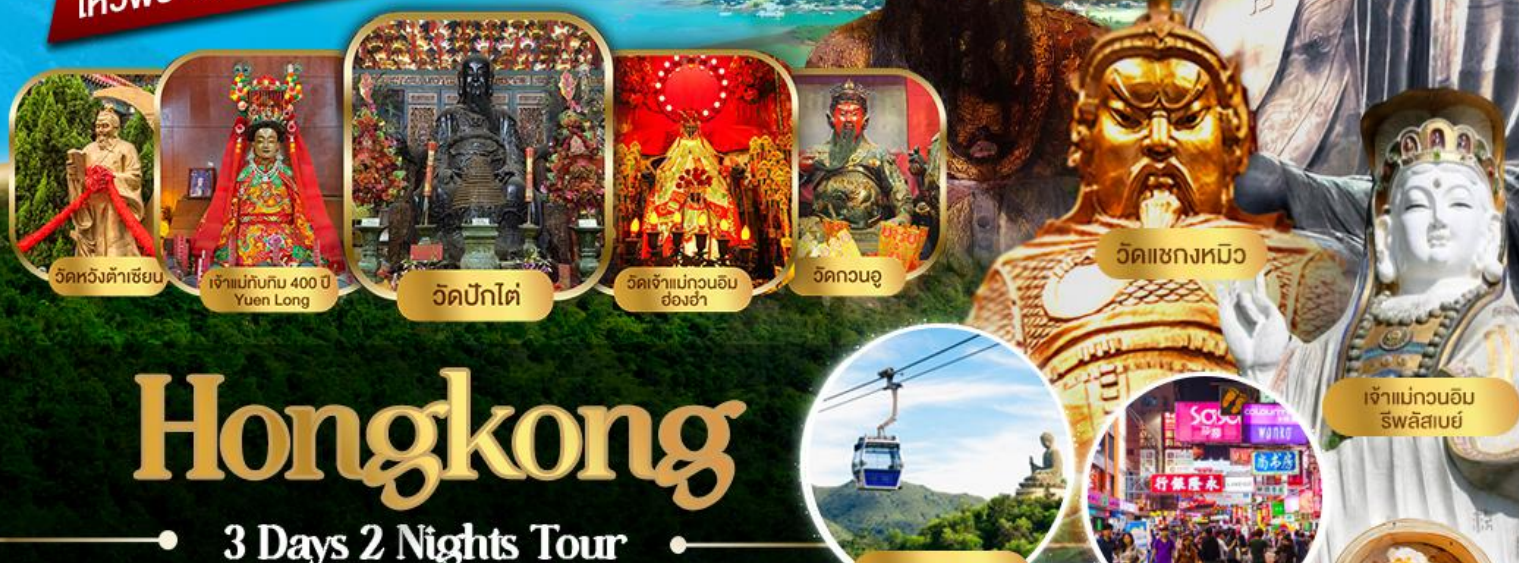
พระใหญ่เทียนถาน

ไหว้พระ 9 วัด พิเศษ!!อาหารเจ 1 มื้อ เสริมบุญบารมี