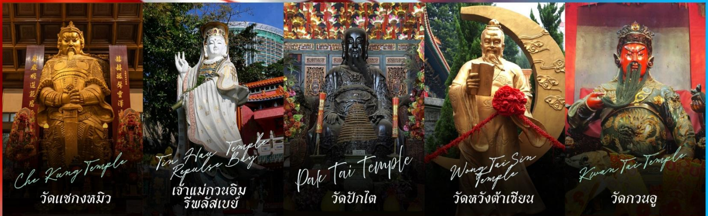
Che Kung Temple วัดแชกงทมิว

รายการทัวร์ข้างต้นอาจมีการปรับเปลี่ยนเพื่อความเหมาะสม