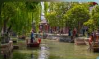
เมืองโบราณจูเจียเจีว

HOLIDAY INN EXPRESS HOTEL หรือเทียบเท่า 4 ดาว