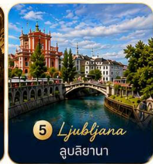
5 Ljubljana ลูบลิยานา