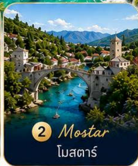
2 Mostar โมสตาร์