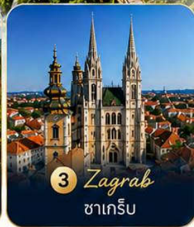
3 Zagreb ซาเกร็บ