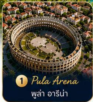
1 Pula Arena ปูลา อารีนา