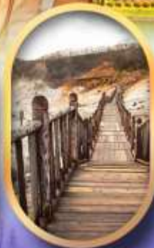
หุบเขาจิกุกดาบิ