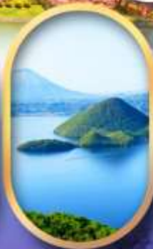
วิวทะเลสาบโทโย