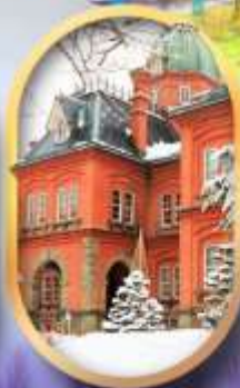
ศาลาว่าการฮอกไกโด