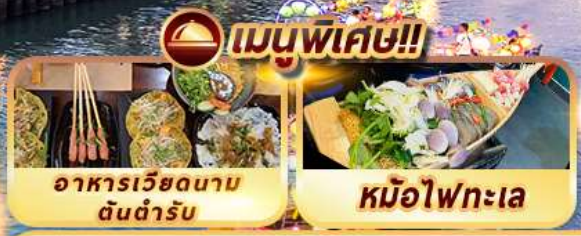
อาหารเวียดนาม ต้นตำรับ