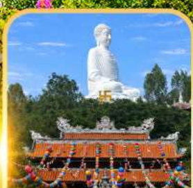
วัดลองเซิน