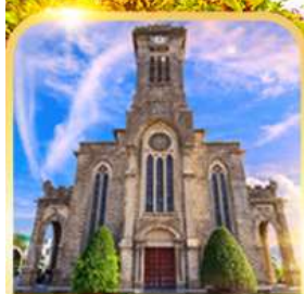
โบสถ์หินญาจาง