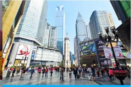
ย่านเจียฟางเปย