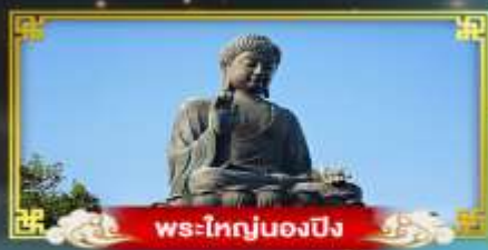
พระใหญ่ของปึง