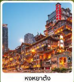
หงหยาดิง