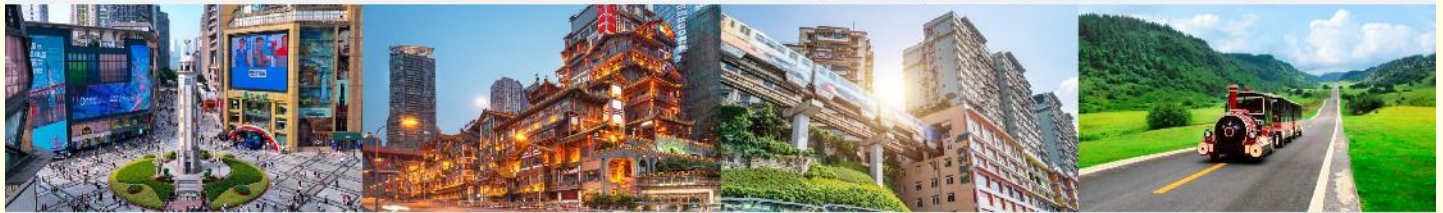
ถนนเจียงฟางเป่ย์