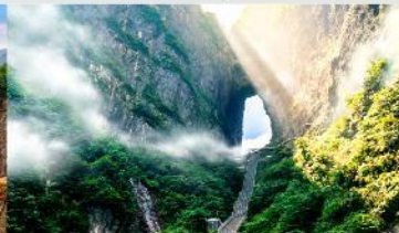
ประตูลัทธิ