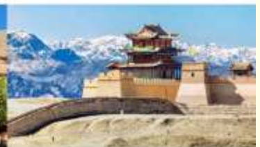
กำแพงเมืองจีน ด่านเจียยวี่กวน

*ทางบริษัทฯ ขอสงวนสิทธิ์ในการสลับโปรแกรมทัวร์ตามความเหมาะสมขึ้นอยู่กับสถานการณ์หน้างาน โดยคำนึงถึงผลประโยชน์ของลูกค้าเป็นสำคัญ