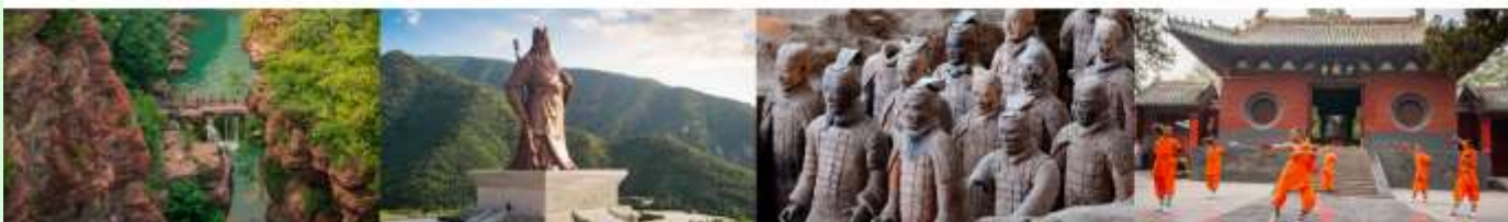
อุทยานสวรรค์หยุนโตซาน