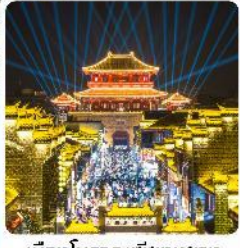
เมืองโบราณเซียงหยาง