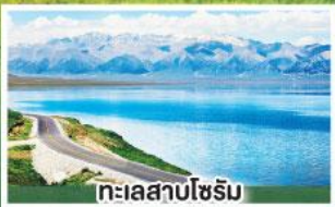
ทะเลสาบไซรัม