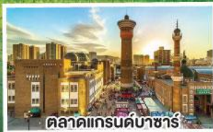
ตลาดแกรนด์บาซาร์