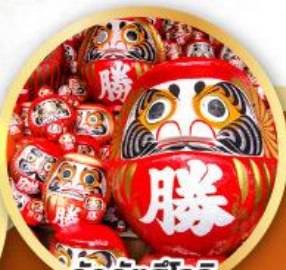
วัดคิตสึโองิ (วัดดาร์มะ)

ชมความงามของกำแพงหิมะ เส้นทางสายอัลไพน์ ทากายามา (JAPAN ALPS SNOW WALL)