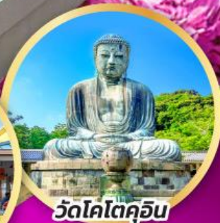
วัดโคโตคุอิน

เทศกาล ชิบะ ซากุระ เฟสติวล (PINKMOSS) CHECK IN จุดชมวิวแห่งใหม่ OWAKUDANI EARTH VALLEY