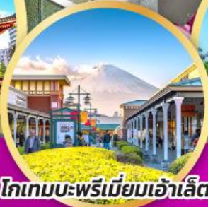
โทเกมบะพรีเมียมเฮ้าส์