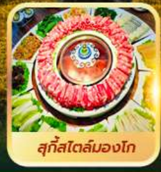
สุกีสโตลมองโก