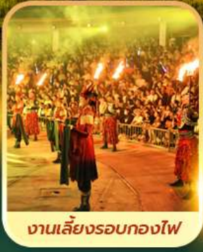
งานเลี้ยงรอบกองไฟ