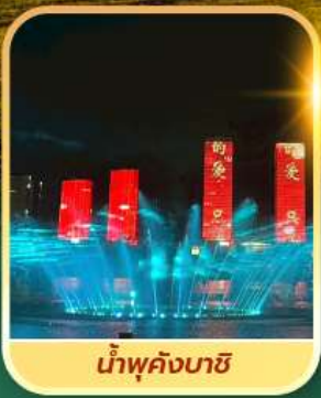
น้ำพุคังบาซี