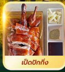
เปิดปอกกิ้ง