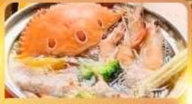
HOT POT SEAFOOD