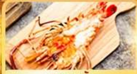
กุ้งแม่น้ำ