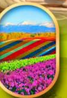
สวนดอกไม้ซิกิโซ