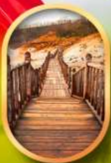
หุบเขาจิกุกาดานิ