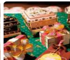
กล่องดนตรี MUSIC BOX