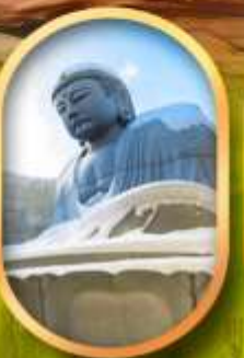
เนินเขาแห่งพระพุทธรเจ้า