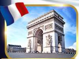
ประตูชัยอาร์กเดอทรียัมป์