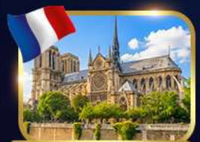
มหาวิหารนอร์เทอ์ดาม