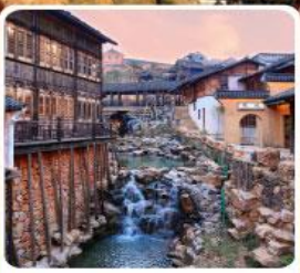
เมืองโบราณเหยahu