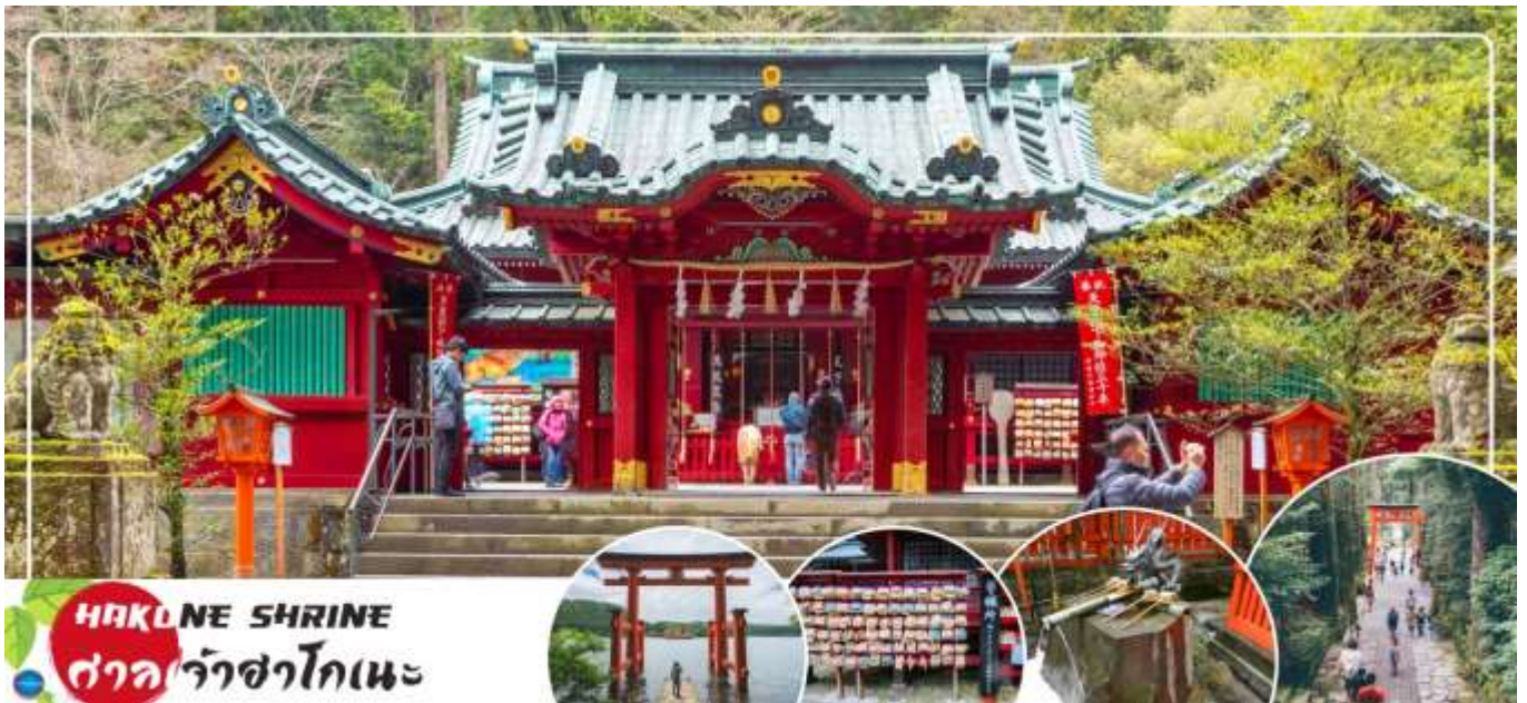
HAKONE SHRINE ศาลเจ้าฮาโกเนะ

จากนั้นนำท่าน ชมวิวทะเลสาบ 5 ศาลเจ้าฮาโกเนะ (Hakone Shrines) (ใช้เวลาเดินทางประมาณ 30 นาที) ศาลเจ้าเก่าแก่ในศาสนาชินโต ตั้งอยู่บริเวณตีนเขาฮาโกเนะ และอยู่ริมทะเลสาบอะชิ จังหวัดคานากาวา ประเทศญี่ปุ่น ไฮไลท์!!! เส้าโทริอิสี่แดง ริมทะเลสาบที่เป็นจุดถ่ายรูปยอดนิยม อีสาระให้ท่านขอพรและถ่ายรูปตามอัธยาศัย