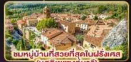
ชมหมู่บ้านที่สวยงามที่สุดในฝรั่งเศส (มูสดีเยแซงมารี)