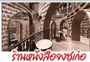
ร้านหนังสือจขูเก้อ