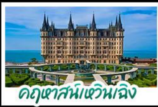
ฤดูหาสมบัติหวิบเจิ้ง

เมืองท่าชิงเต่า - ฤดูหาสมบัติหวิบเจิ้ง เบียร์ชิงเต่า + อาหารทะเล สตรีทอาร์ต สตูดิโอจิบลิ