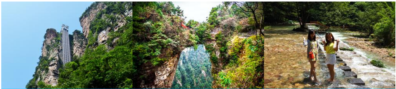
ลิฟท์แก้วไปหลง

หลังอาหารเช้าเดินทางสู่ อุทยานแห่งชาติจางเจียเจี้ย 张家界森林公园 นำท่านโดยสารรถบัสของเขตอุทยานไปยัง สถานีลิฟท์แก้วไปหลง 百龙天梯 ให้ท่านโดยสารลิฟท์แก้วขึ้นสู่จุดชมวิวในเขตอุทยาน หยวนเจียเจี้ย 袁家界 จุดชมวิวยอดนิยม บนเขาอวตาร ลิฟท์แก้วไปหลง เป็นลิฟท์แก้วชมวิวแบบสองชั้นที่สร้างขึ้นเลียนหน้าผาแนวดิ่งที่มีความสูงราว 325 เมตร เป็น ลิฟท์แก้วชมวิวกลางแจ้งความเร็วสูง ขนาดใหญ่ที่ทำลายสถิติกินเนสบุ๊ค.....ท่านจะตื่นตาตื่นใจกับทัศนียภาพบนเขาอวตาร บนความสูงถึง 1,250 เมตรเหนือระดับน้ำทะเล อาทิ ยอดเขาฮาหลิวยา 哈利路亚山 ภูเขาลอยฟ้าโด่งดังที่เป็นฉากถ่ายทำภาพยนตร์เรื่องอวตาร