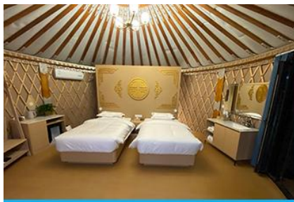
ห้องพักสไตล์มอว์โกเลียน