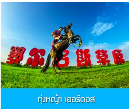
ทุ่งหญ้า เออร์ดอส

พักที่ ORDOS BOYU AIRUI HOTEL โรงแรมระดับ 4 ดาวท้องถิ่น หรือเทียบเท่าในเมืองเออร์ดอส